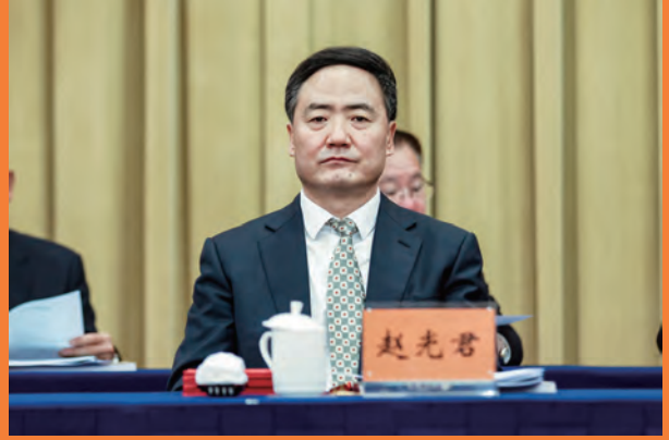
赵光君 省人大常委会党组成员、副主任