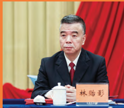
林贻影 省人民检察院党组书记、检察长