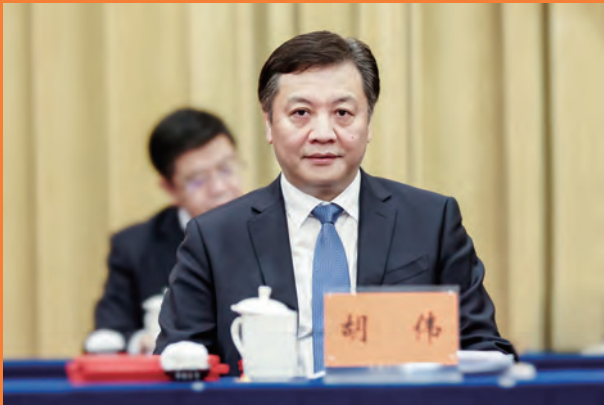
胡伟 省政府副省长