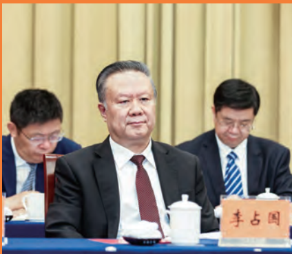
李占国 省高级人民法院党组书记、院长