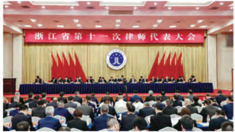
浙江省第十一次律师代表大会开幕式

17日，浙江省第十一次律师代表大会在杭州召开。浙江省委常委、政法委书记、省委依法治省办主任王成国出席开幕式并讲，省协会会长蒋子程视频致辞，浙江省人大常委会党组成员、副主任赵光碧，浙江省政府副省长胡伟，浙江省政协党组副书记、