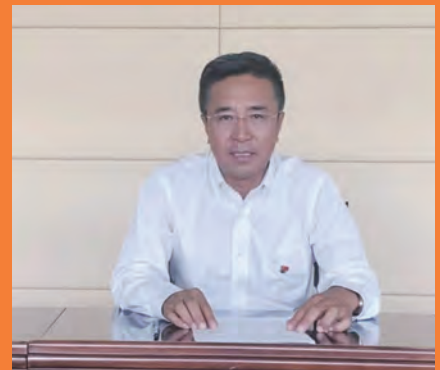
高子程 中华全国律师协会会长