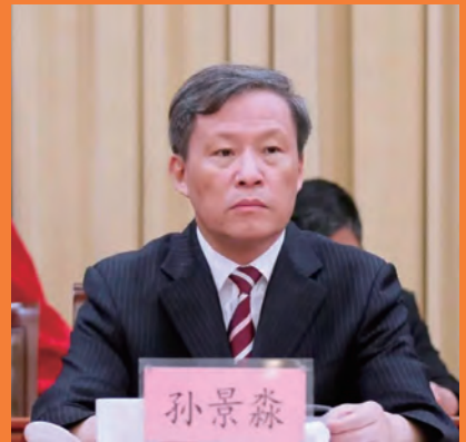
孙景森 省政协党组副书记、副主席