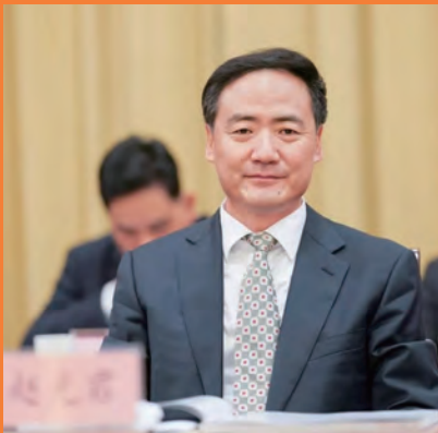
赵光君 省人大常委会副主任