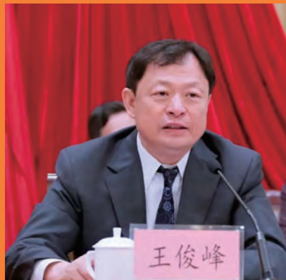
王俊峰 全国律师行业党委副书记 中华全国律师协会会长