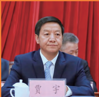
贾宇 省人民检察院检察长