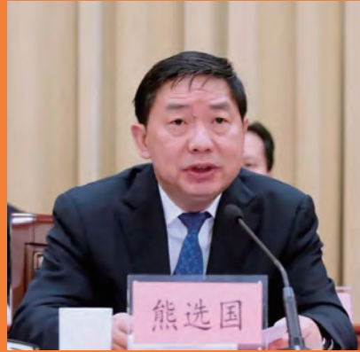
熊选国 司法部副部长 全国律师行业党委书记