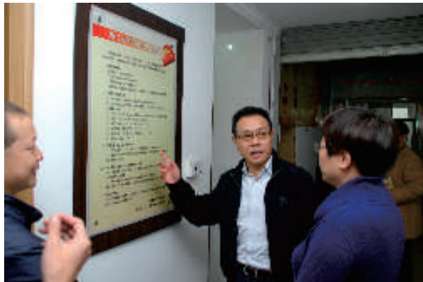
▲ 陈三联秘书长赴常山县调研律师工作

多层次开展培训工作,铺好“成才”之路。“名律师”培育关键就在于培养行业管理和专业领域领军人才。为此,省律协举办首期青年骨干律师培训班,邀请了经济、法律等领域的知名专家、学者为青年骨干律师授课,以期培育律师行业管理接班人。通过举办第5期青年律师训练营,着力提升知识产权专项业