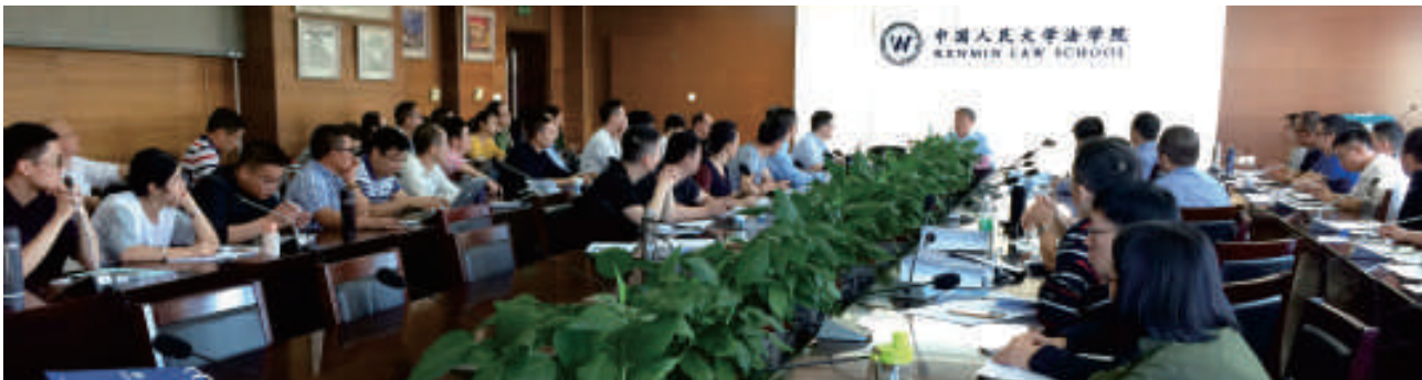
▲ 温州破产管理协会会员在中国人民大学法学院培训

培训率近100%。宁波市除举办律所内部培训与交流外，积极选派律师走出去，到香港参加“青年律师论坛”，赴美进行一个月的国际知识产权培训。派员参加独立董事资格、破产管理人业务、私募基金政策，以及由最高检组织的“律师介入涉诉涉法案件研讨会”等各级各类培训。