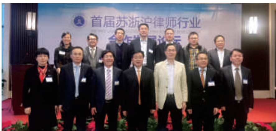
参加首届苏浙沪律师行业合作发展论坛的浙江代表团成员合影

【本刊讯】11月26日在江苏常熟市举行的首届苏浙沪律师行业合作发展论坛上，苏沪浙三地律协签订《律师协会战略合作备忘录》，全面建立三地律师界紧密型战略合作关系。全国律协秘书长何勇到会讲话，副秘书长马国华参加会议。北京、上海、江苏、浙江司法厅（局）分管律师工作的领导、律管处长、律协会会长、秘书长及律师代表近百人参加会议。