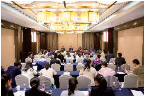
▲ 信息化操作培训现场

力。这样的信息化意义何在呢？”信息化的作用，在一个小的环节中也许并不明显，但是站在更为长远的角度看，信息化可以为后续统计、核对、日常管理带来巨大的便利，甚至可以为科学决策提供依据。