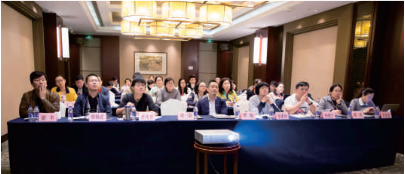
▲ 2016年第二期信息化操作培训班

5月初,杭州律协率先试用网络信息化系统,从地市律协实际需要的角度,对平台功能和流程的完善提出意见。