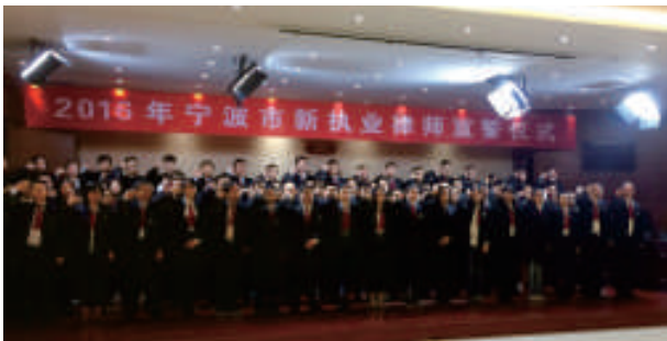
▲ 宁波举办新执业律师宣誓仪式

青年律师与骨干律师,是律师队伍发展的两个关键群体。各地由此着手,多管齐下,精准发力。杭州、宁波、湖州、嘉兴、丽水等地,力争将律师人才培养纳入当地人才发展规划。台州市司法局联合市委组织部,制定了律师行业“251人才培养计划”,从2017年起,利用4年时间培养20名领军人才、50名骨干人才和100名青年精英人才。一些地方还争取到当地律师培养的政府专项资金。