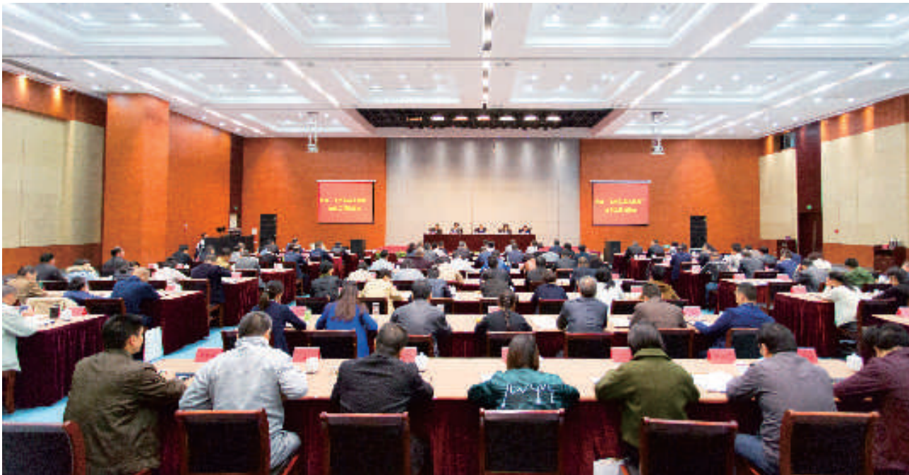
▲ 全省“三名工程”推进会

互动机制的意见》，成立律师服务团，推动省公安厅出台《看守所保障律师会见权“十不准、十服务”规定》。