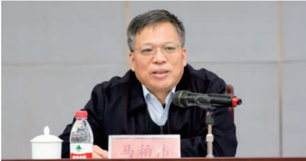
▲ 马柏伟厅长在“三名工程”推进会上讲话

积极开展调研，规范个人所建设。 3月中旬，省律协律所管理指导委员会赴宁波专题调研个人律所发展现状。调研组先后走访了海泰、欧硕、易腾及波宁律所，召开座谈会，听取汇报征求建议。通过多地调研，就我省个人所普遍存在的规模小、业务少、管理弱等问题，掌握了不少实情，为下一步出台相关指导意见做了充分准备。