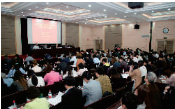
▲ 知识产权巡回宣讲

【本刊讯】 知识产权大省浙江，应成为知识产权保护的先进省。积极致力于知识产权保护工作的省律协，开展知识产权宣传巡回演讲已7年，取得了良好效果，受到多方好评。