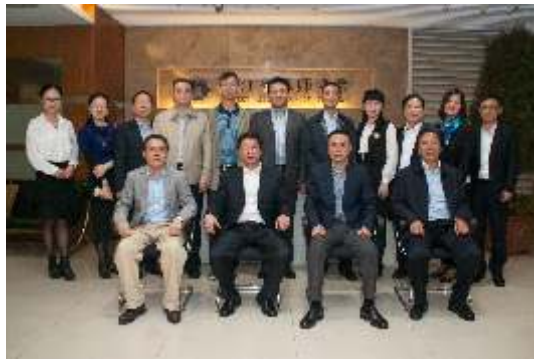
▲ 湖南律协代表团来浙考察交流

——提升律师行业影响力。开展省律协优秀专业委员会、专业委员会先进个人、优秀专业论文评选;对有贡献的集体或个人进行年度嘉奖或通报表扬;办好《浙江律师》杂志,明显提升刊物质量;改进和提高神州律师网、微信公众号和工作专报、简报等,充分发挥它们的宣传作用,积极促进行业发展。