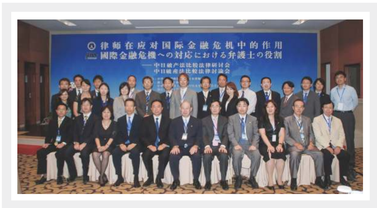
出席在杭举办的第二届中日律师法律研讨会