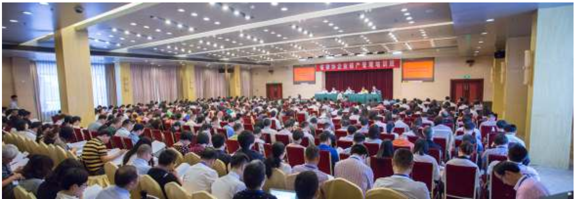
▲ 第四期企业破产管理人业务培训班

题采访,对我省律师工作进行深度报道。全省律师工作会议期间,在浙江日报、法制日报上头版或专版宣传相关情况。上半年,各级媒体报道我省律师工作100余篇(次)。利用协会自有媒体进行宣传。开通省律协微信公众号,充分利用新媒体便捷优势,开展信息推送和工作宣传,发布信息63条,阅读量3.7万次;继续与《浙江法制报》联手办刊,出版3期《浙江律师》;对神州律师网进行全新改版,提升日常运管维护,发布各类信息266篇。