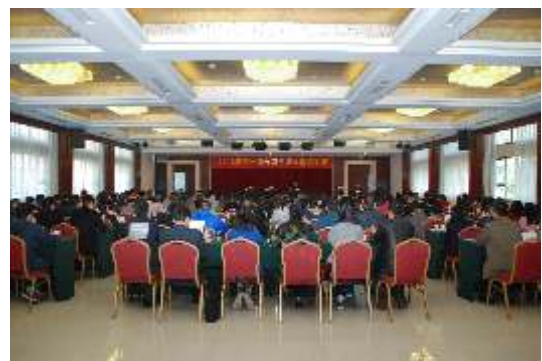
▲ 公职律师岗前培训班

做好秘书处日常工作。 进一步做好和省厅律管处的工作对接,推进完善协商、共享等工作机制。抓好制度建设,协助起草行业制度8件,创设秘书处各部门月度工作计划和月度工作统计制度。做好行业交流接待工作,接待全国律协及上海、重庆、湖南、宁夏律协等来访调研13批次。进一步规范财务管理,制定省律协差旅费管理和公务接待试行办法,配合相关部门完成审计抽查。