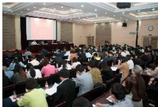
▲ 知识产权巡回宣讲

起草律师会见在押犯罪嫌疑人、被告人规范及违规行为处分指导意见、会员违规行为查处规则、惩戒委员会案件审理工作规则等规范性文件;对2015年全省律师行业处分情况进行年度通报;做好重大情况报告事项收集、汇总工作,共收集27件。上半年,全省行业处分律师11名、事务所2家;其中训诫2人,通报批评6人、2所,公开谴责3人;在神州律师网、《浙江律师》杂志发布处分信息8件。