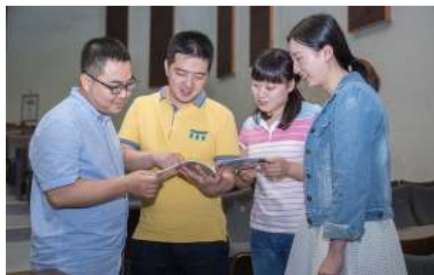
▲ 省律协培训部老师商讨教学内容