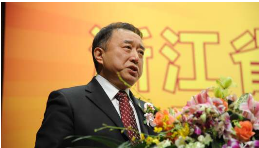
◀ 在浙江省第八次律师代表大会上致辞

没有任何的特殊化。在伦敦和曼城，我们住的酒店，是英方安排的那种古老欧式小酒店，似乎每个房间的大小、设施都不一样，而我每次拿到的房间都非常幸运，比如比较大，或有个花园大阳台，或有一圈沙发等。一串门发现，还是团长房小，我要跟于会长换。于会长总是摆手，不用不用，都一样，还打趣地说，等下我们到你这里泡龙井茶喝。其实，凭他的身份，完全是可以安排套房的，但他没有这样做。连坐飞机也是跟我们一样的经济舱，真的是难能可贵。