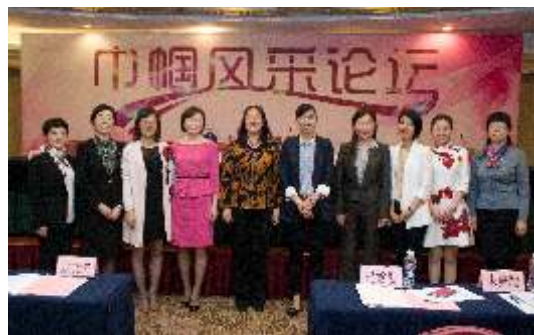
▲ 首届女律师“巾帼风采”论坛

部及广大妇女群众，开展为期8个月的《反家庭暴力法》及婚姻家庭相关知识解读和咨询。充分发挥“浙商律师服务团”以及省律协“五水共治”律师志愿团的职能作用，继续在全省开展巡诊式的法律服务。组织律师参加2016年度外贸预警示范点和外贸企业巡回服务活动。组织20名专家律师参加省政协开展的“送法律下乡”活动，通过公益讲座、法律咨询、调研走访，为企业、村居干部、村民答疑解惑。