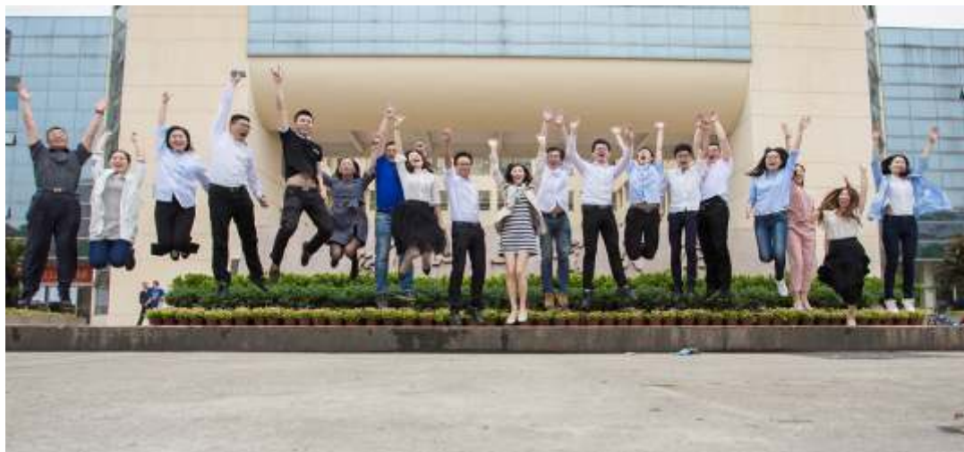
▲ 2016年第三期浙江律协岗前培训班

省律协根据考勤记录、理论考试成绩、模拟法庭表现等综合情况，评选出10名优秀学员，并在结业典礼上颁发荣誉证书。