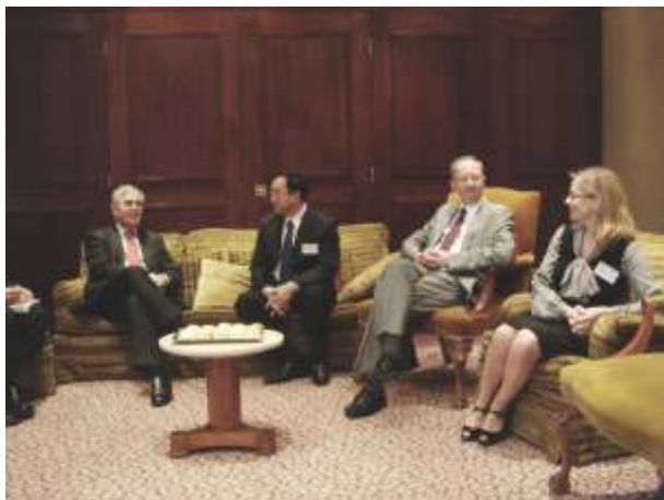
代表团访问苏格兰律师公会

前，英方必会表达向地震罹难者表示哀悼，对遭受地震灾难的中国人民表示慰问。于会长在致辞中一一作回应，代表中国律师及代表团表示感谢。并结合自己在军队服役期间曾参加唐山大地震抢险救灾的经历，告知英国朋友，中国政府、军队和人民一定会尽最大努力，保护好人民生命财产安全，尽快恢复生产、生活，重建家园。于会长的讲话声情并茂，有理有据有高度，坚定而有信心，每每博得长时间的掌声。这个掌声，既是为我国政府、军队、人民的积极作为而鼓，也是为于会长的真情表达而鼓。我国驻英大使馆指派的资深翻译（曾服务过多位高层次领导），私下对我们说：“这样高水平的领导真不多见。”